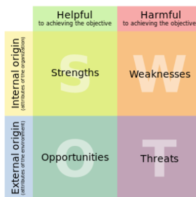
Slika 1: Shema SWOT analize

Tablica 1: SWOT matrica s elementima koji predstavljaju polazište u daljnjem razmatranju strateških odrednica razvoja Komore u planskom periodu – 2018. godina