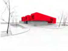
OSNOVNA ŠKOLA KUŠLANOVA - ZAGREB