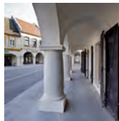
PJEŠAČKA ZONA VUKOVAR