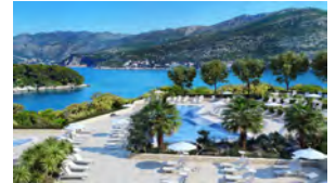
BAZEN HOTEL ARGOSY BABIN KUK