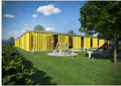
DJEČJI VRTIĆ SESVETSKI KRALJEVEC