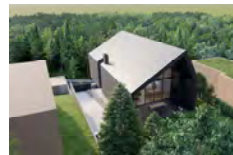
STAMBENA ZGRADA SAMOBOR