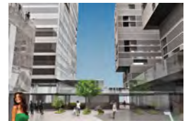
CENTAR STROJARSKA ZAGREB