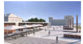
PROSTOR BATARIJE TROGIR