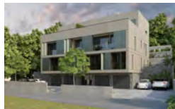
STAMBENA ZGRADA ZAGREB