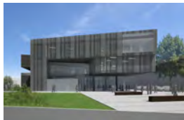
SVEUČILIŠNI CENTAR OSIJEK