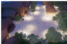
TRG REPUBLIKE ČAKOVEC