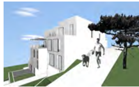
STAMBENE ZGRADE RIJEKA