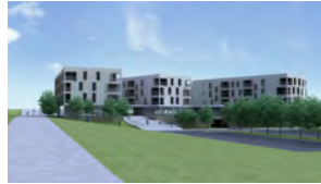
STAMBENE ZGRADE LABIN