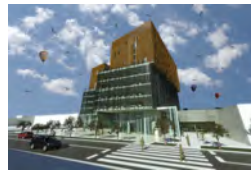
POSLOVNO STAMBENI CENTAR - OSIJEK