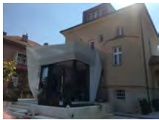
STAMBENA ZGRADA ZAGREB