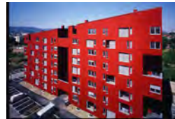
POS VRBANI ZAGREB