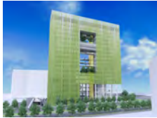
POSLOVNI NEBODER ZAGREBAČKA - ZAGREB